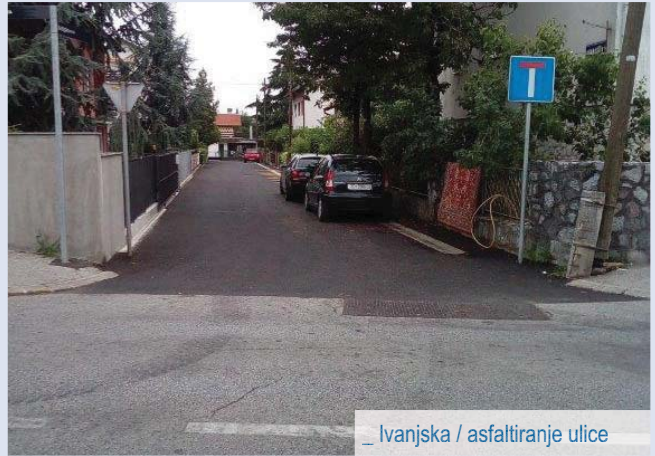
_ Ivanjska / asfaltiranje ulice