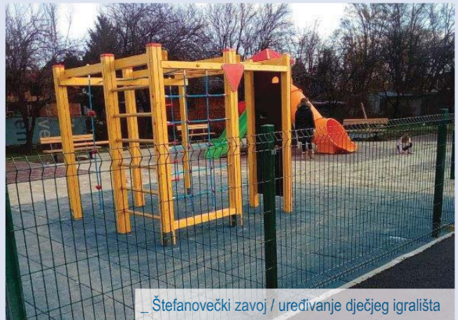
_ Štefanovečki zavoj / uređivanje dječjeg igrališta