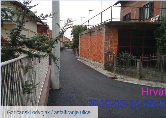
_ Goričanski odvojak / asfaltiranje ulice