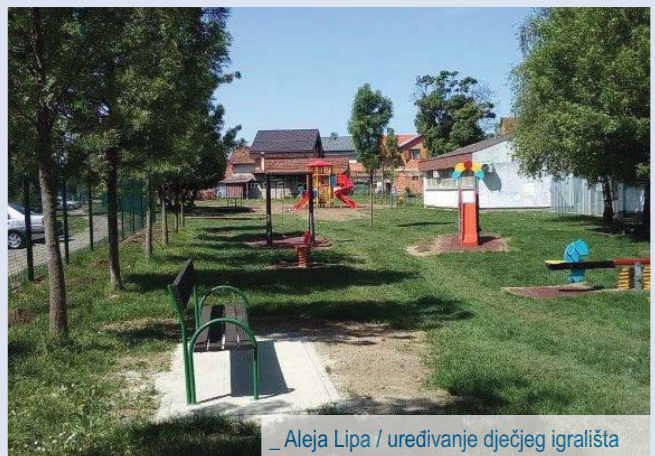
_ Aleja Lipa / uređivanje dječjeg igrališta