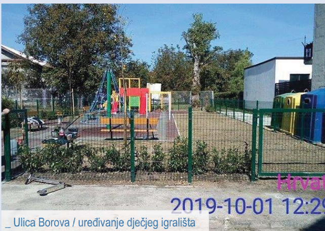
_ Ulica Borova / uređivanje dječjeg igrališta