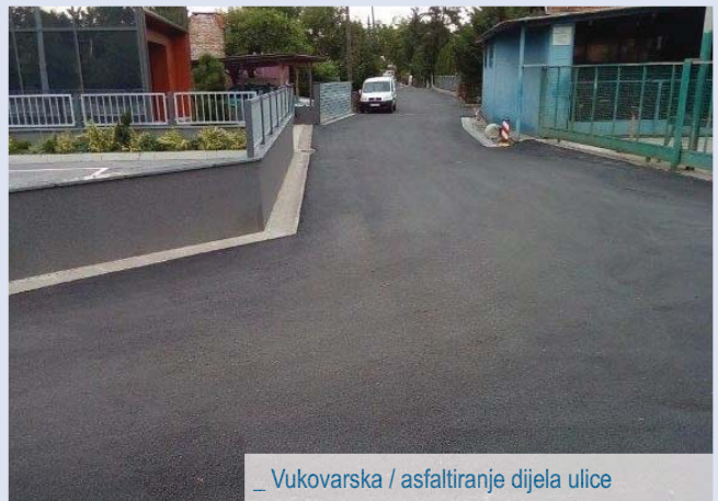
_ Vukovarska / asfaltiranje dijela ulice