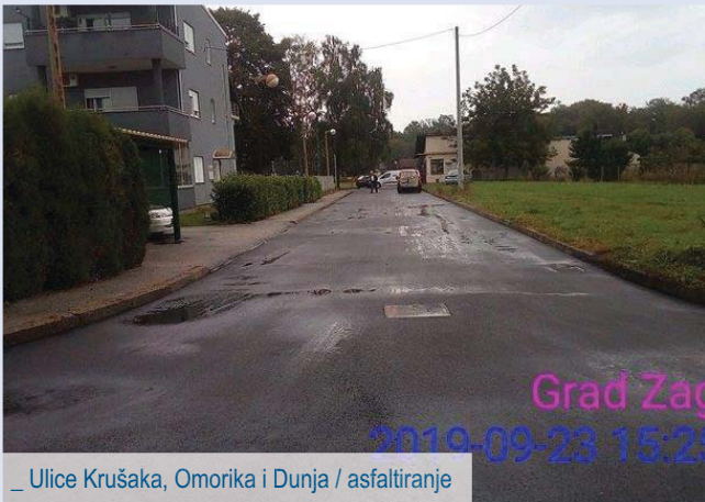
_ Ulice Krušaka, Omorika i Dunja / asfaltiranje