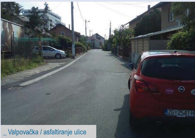
_ Valpovačka / asfaltiranje ulice